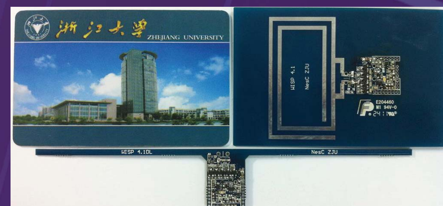
WISP-based Access Card

Dans cette invention, un système novateur de contrôle d'accès basé sur une Identification Sans Fil avec Plateforme Sensitive (WISP) est développé, qui utilise une puce passive UHF RFID avec MCU et accéléromètre incorporés dans la carte d'accès. L'autorisation d'accès ne sera accordée que si (1) l'utilisateur effectue une série de rotations prédéfinies avec sa carte et (2) l'information d'identification correspond à une entrée valide dans la base de données. Ce système combine une identification par puce RFID (authentification électronique) et des mouvements prédéterminés de rotation de la carte (authentification mécanique) pour permettre un contrôle d'accès hautement sécurisé transmissible entre utilisateurs de confiance.