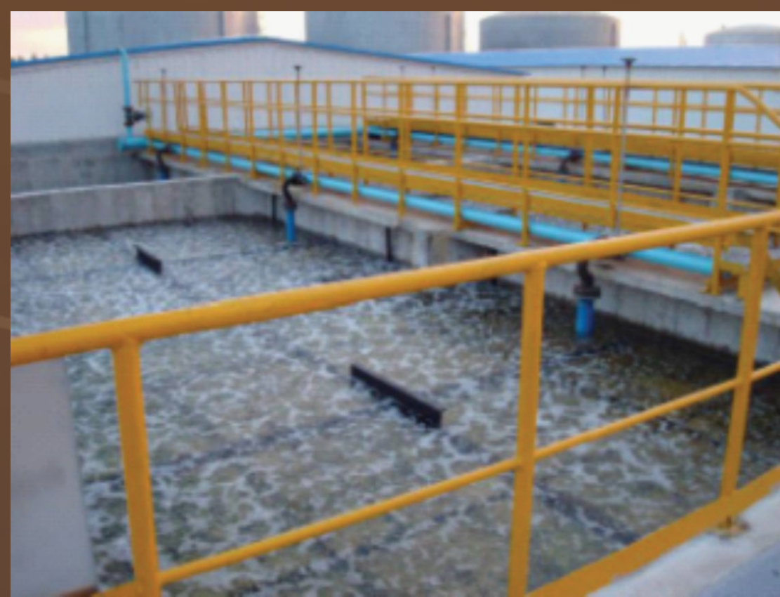
Immobilized Biological Aerated Filter Pool

A novel technique based on the immobilized micro-organisms technology combined with biological aerated filter is developed. The immobilized carrier composed of functional polyurethane has a macroporous and netted structure with reactive groups such as hydroxyl, carbonyl, amino and acylamino attached on it. With the unique pore structure, the micro-organisms can be immobilized on the carrier effectively, and survive and strengthen under highly toxic environment, resulting in high degradation efficiency for wastewater.