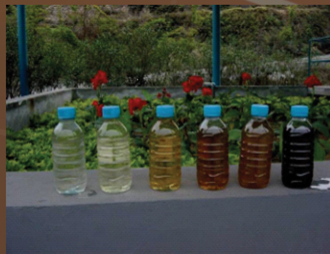
Landfill leachate before and after treatment