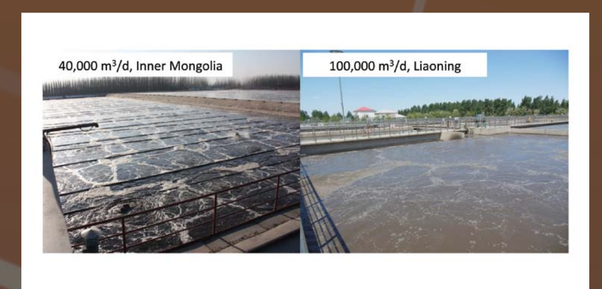
Full-scale upgrade and reconstruction cases based on PCN process